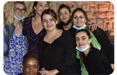
Comité des fêtes

La Fête nationale a démarré le 13 juillet par un discours prononcé par M. le Maire, entouré de ses adjoints et conseillers municipaux, depuis le balcon de la mairie. S'en est suivi la traditionnelle retraite aux flambeaux dans les rues du village. Un repas et une soirée dansante animée par l'équipe Light & Sound ont été organisés sur la place du Belvédère par le Comité des fêtes. Malgré quelques gouttes de pluie, « le Grand Bal » a eu un franc succès. Dans cette longue période de restrictions, les Bouzigauds avaient bien besoin de ce moment de communion dans les valeurs de la République et la joie des festivités.