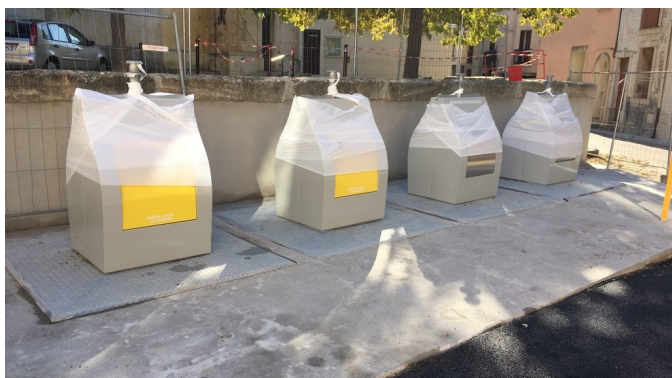
Containers enterrés Place de la Victoire