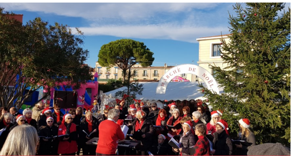
Marché de Noël, la chorale