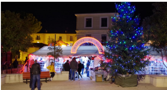
En attendant Noël