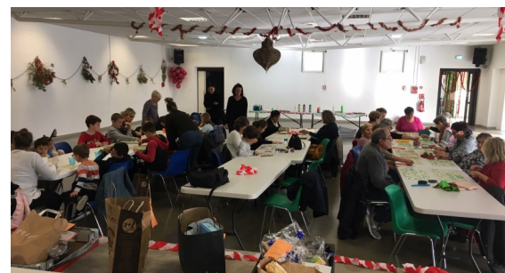
Loto intergénérationnel Accueil de Loisirs