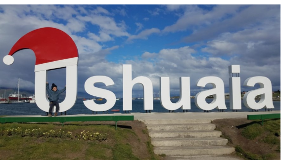
Planète en commun, arrivée à USHAÏA !