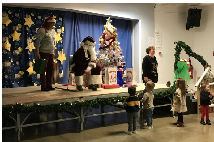
Noël des Assistantes Maternelles

Plus de photos, vidéos sur Facebook : Mairie Bouzigues