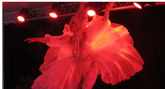
Repas offert aux aînés par la Municipalité