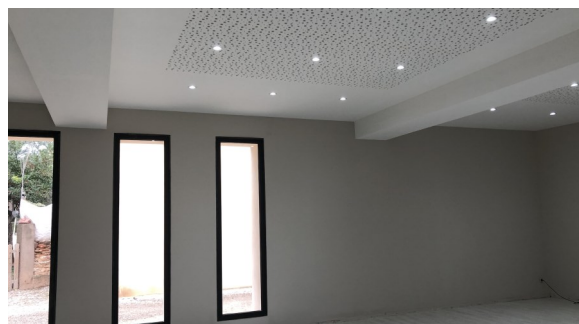
Rénovation Salle des Mariages