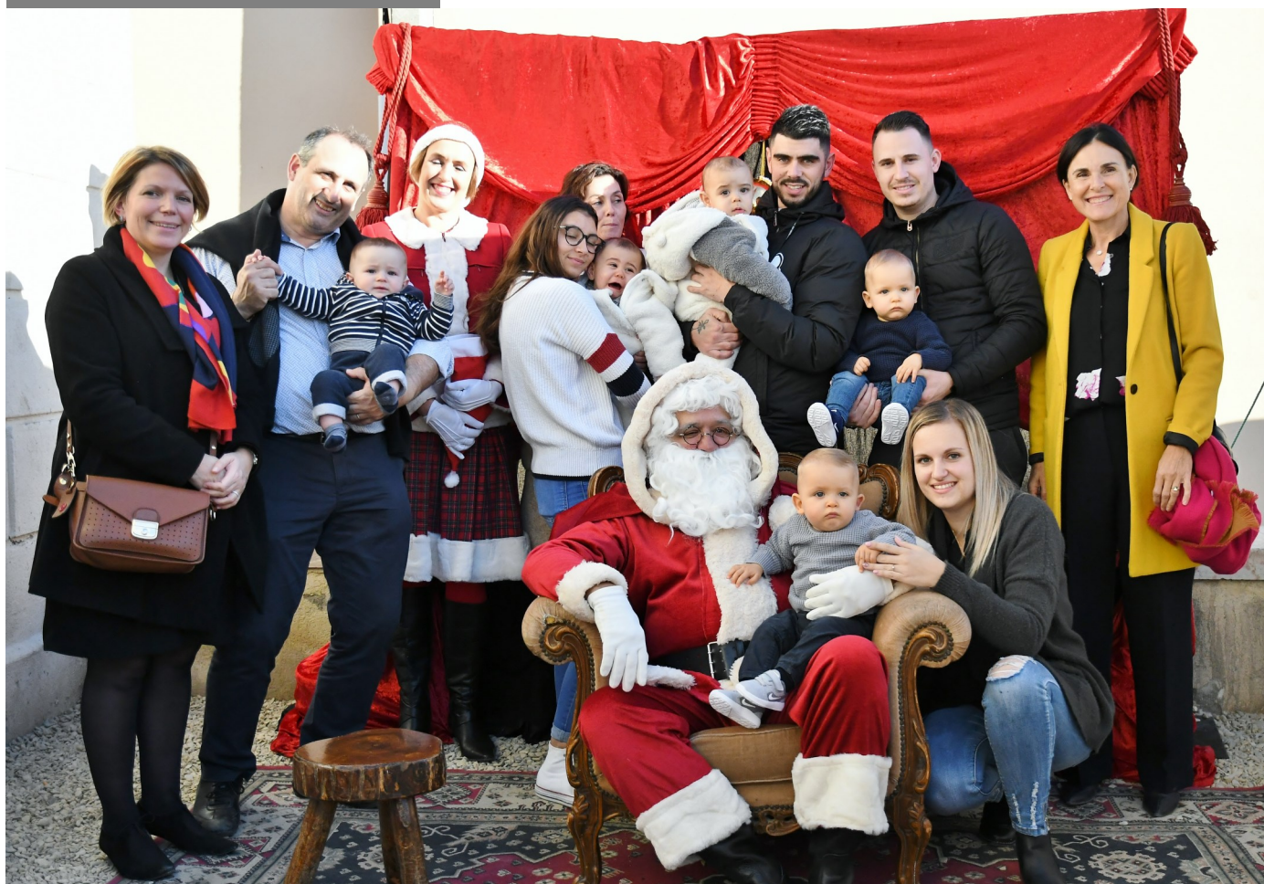
Les bébés de l'Année

En cette période de Noël , les élus et moi même pensons bien à vous et nous vous envoyons nos souhaits les plus chaleureux.