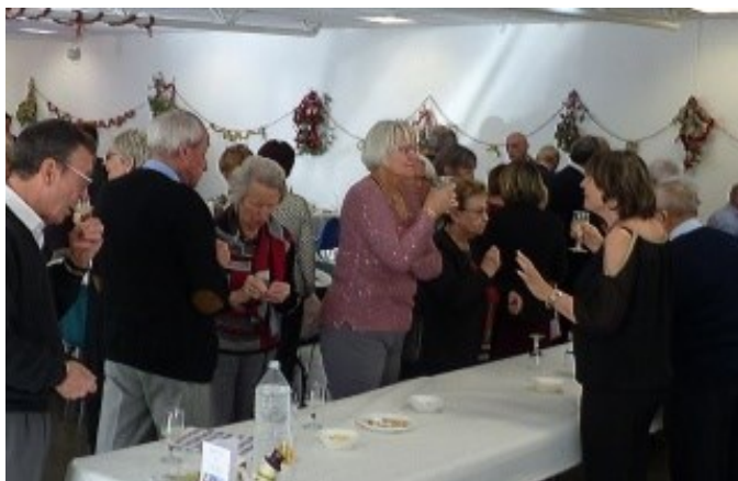
Repas de Noël du Club de l'âge d'Or