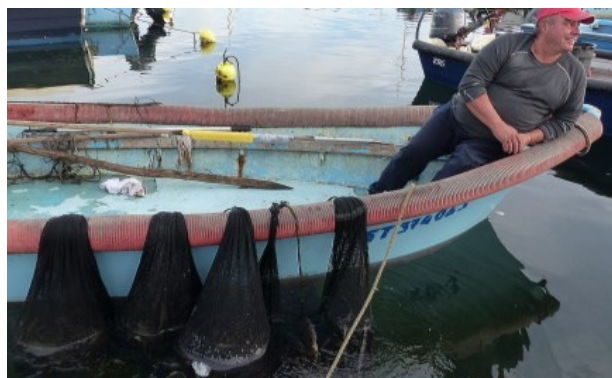
Lâcher d'anguilles vers la Mer des Sargasses