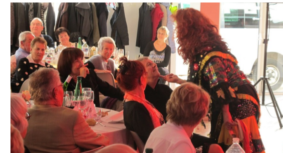
Repas offert aux aînés par la Municipalité