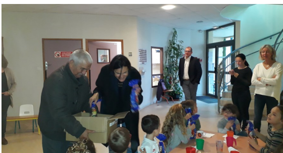
Goûter de Noël Ecole