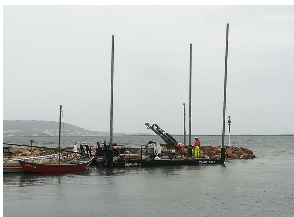
Sondage profondeur du Port