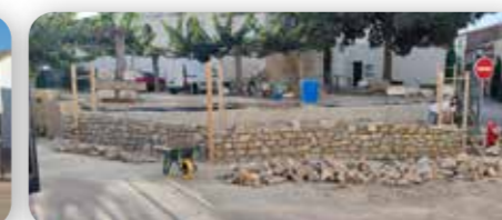
Place de la Victoire - 2022