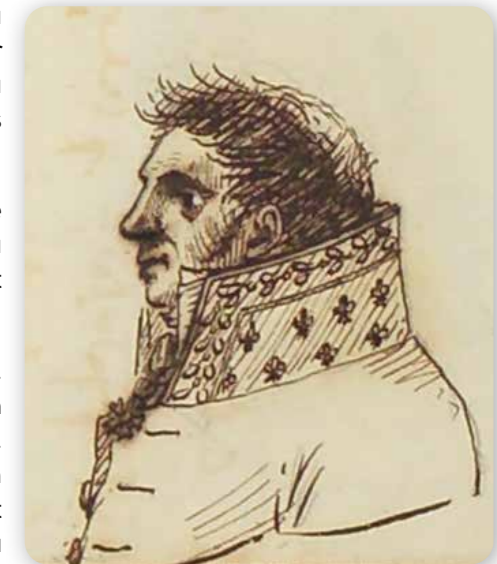
Le Baron Séguier

Napoléon n'aime pas le baron Séguier qui, au fond, est resté royaliste. L'Empereur fait surveiller la famille, notamment la belle-mère du baron parce qu'elle reçoit des envoyés du pape, soutiens des anciens monarques. Napoléon n'a pas tort de se méfier : dès la chute de l'Empire, le baron Séguier se rallie à la Restauration. Plusieurs gravures d'époque se moquent des revirements politiques du baron, jusqu'en 1848, où il prétend passer du côté de la nouvelle République.