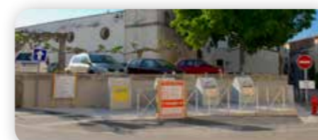
Place de la Victoire - 2019

La suppression du sens interdit qui coupait l'avenue en deux, au niveau de la pharmacie, et la remise en état du plan de l'église réparent les blessures récentes faites à l'urbanisme classique et bien pensé qui structure notre petite commune depuis belle lurette.